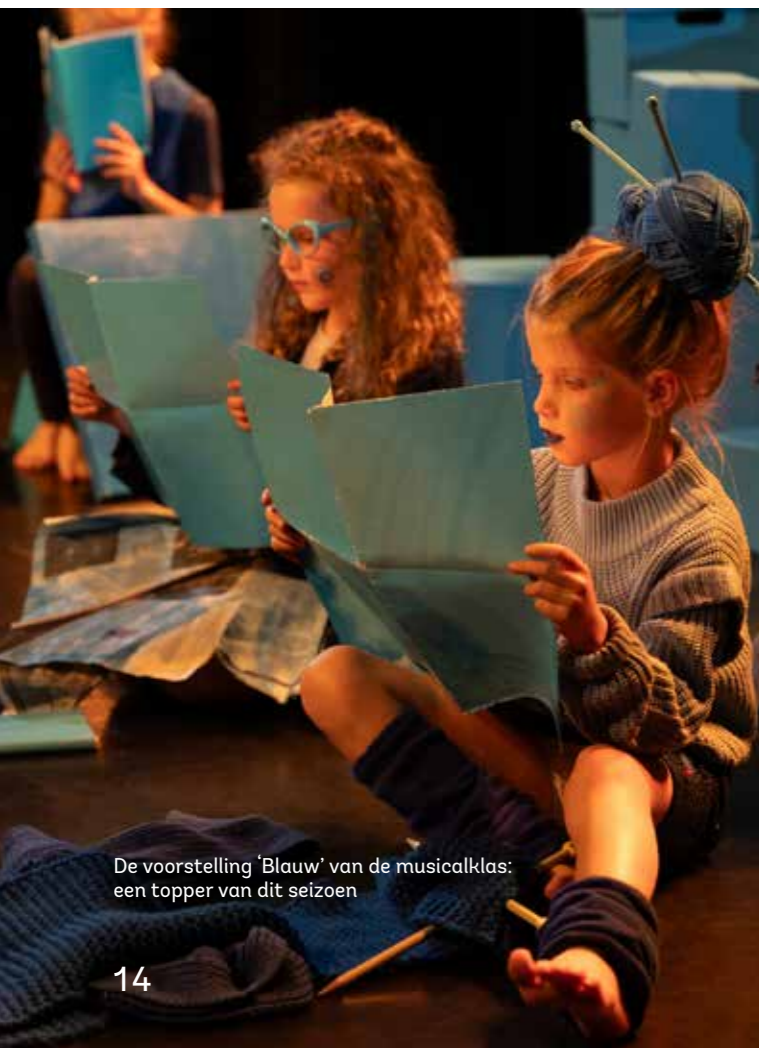
De voorstelling 'Blauw' van de musicalklas: een topper van dit seizoen

Een duidelijke trend is de groeiende belangstelling voor volwassencursussen, zoals acteren en theatersport. Musicallessen worden bij de jeugd steeds populairder. Daarom zijn we in Soesterberg gestart