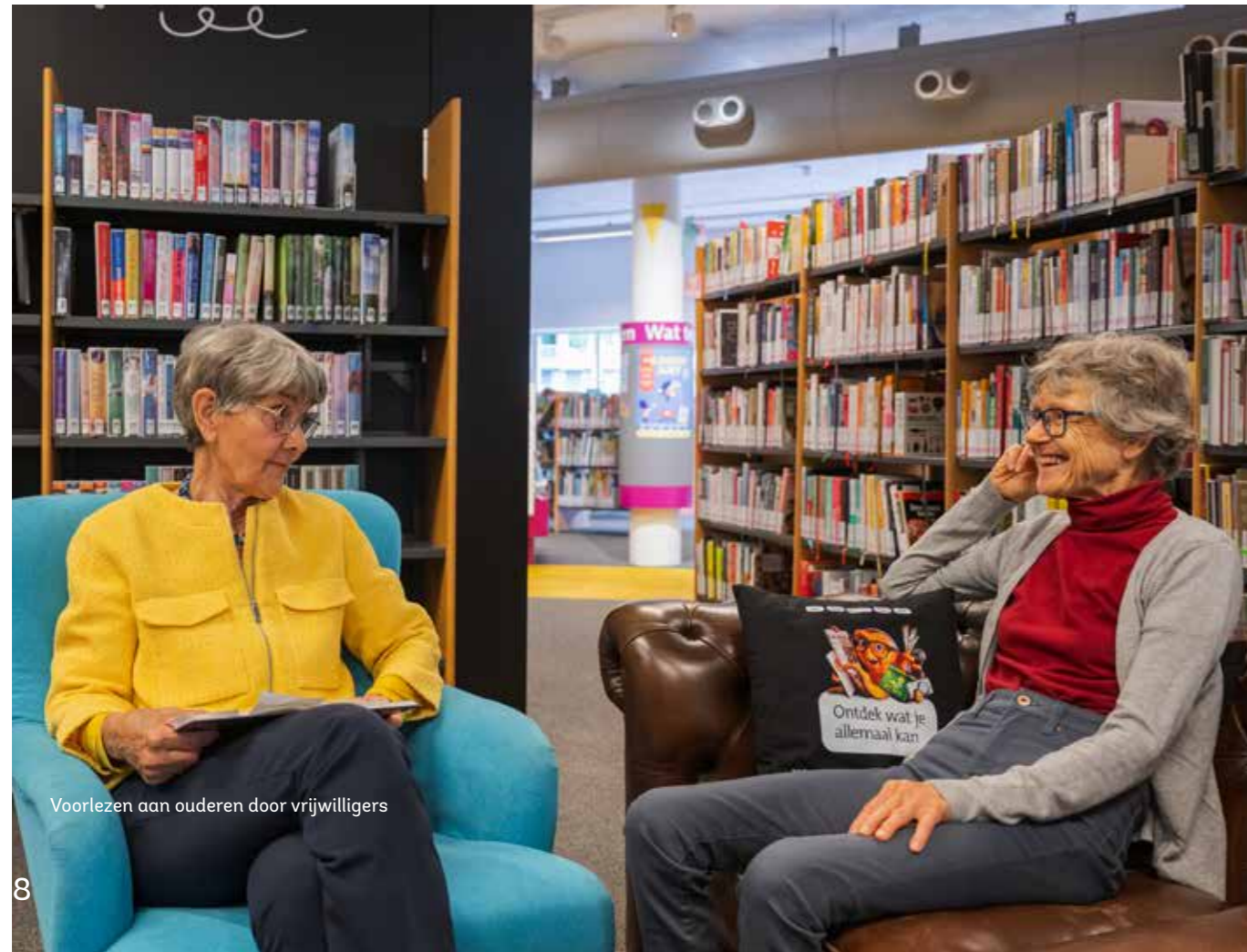
Voorlezen aan ouderen door vrijwilligers

"Ik heb de hulp als prettig ervaren. Leerzaam, interessant, goede leraar. Kundig en wijs en geduldig."