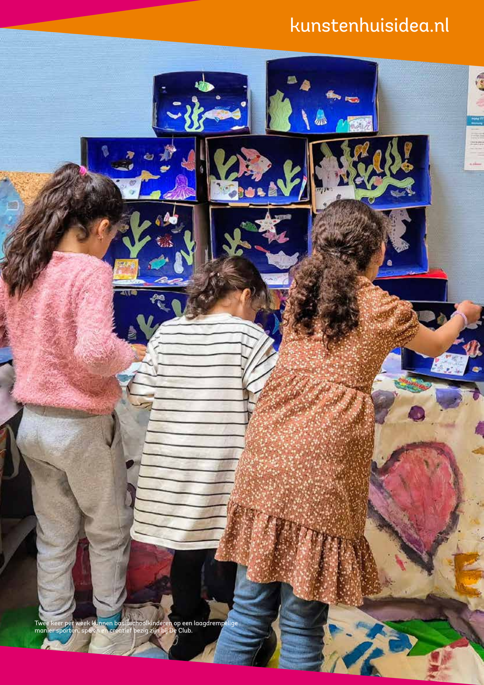
Twee keer per week kunnen basisschoolkinderen op een laagdrempelige manier sporten, spelen en creatief bezig zijn bij De Club.