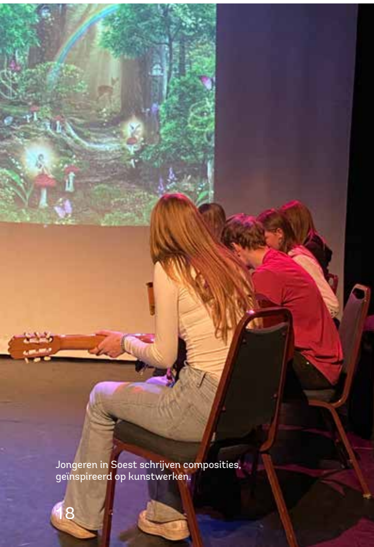
Jongeren in Soest schrijven composities, geïnspireerd op kunstwerken.

Binnen KunstLokaal voerden we samen met Kunst Centraal diverse projecten uit. Team Onderwijs en Team Leesbevordering werkten per programma nauw samen. De projecten zetten verbeelding in om de kunstzinnige vaardigheden en leercompetenties van leerlingen te versterken.