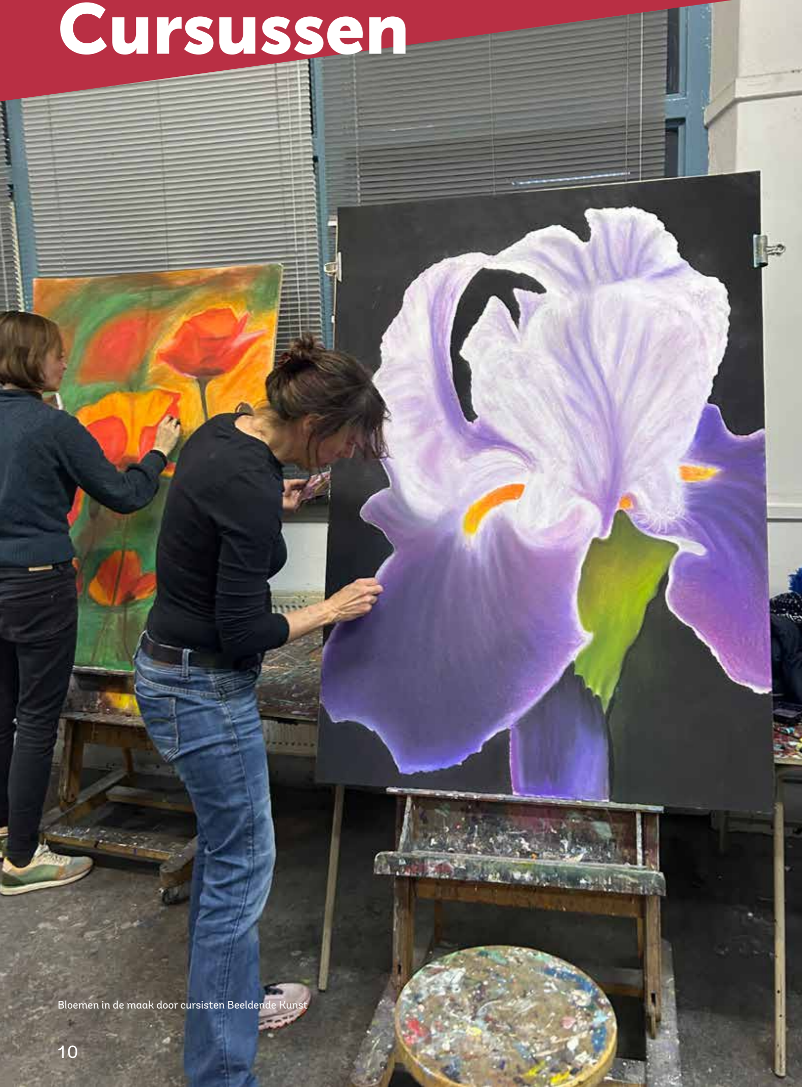
Bloemen in de maak door cursisten Beeldende Kunst

Bij KunstenHuis Idea kunnen mensen van alle leeftijden hun creativiteit ontdekken en ontwikkelen. Daarom bieden we een breed scala aan cursussen en workshops in beeldende kunst, dans, muziek, theater en de Volksuniversiteit, allemaal afgestemd op de wensen van de gemeenschap en de mogelijkheden van onze diverse locaties.