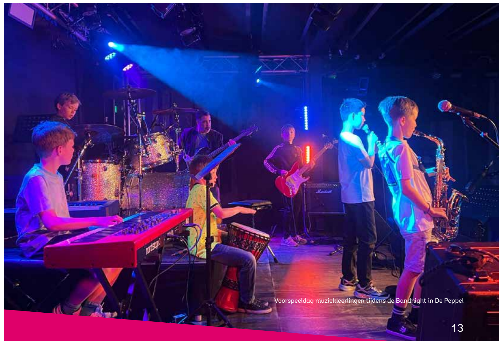
Voorspeeldag muziekleerlingen tijdens de Bandnight in De Peppel

“Wekelijks spelen we in de Lichtruim Bigband heerlijke swingmuziek en ik besef hoeveel plezier dat geeft.”