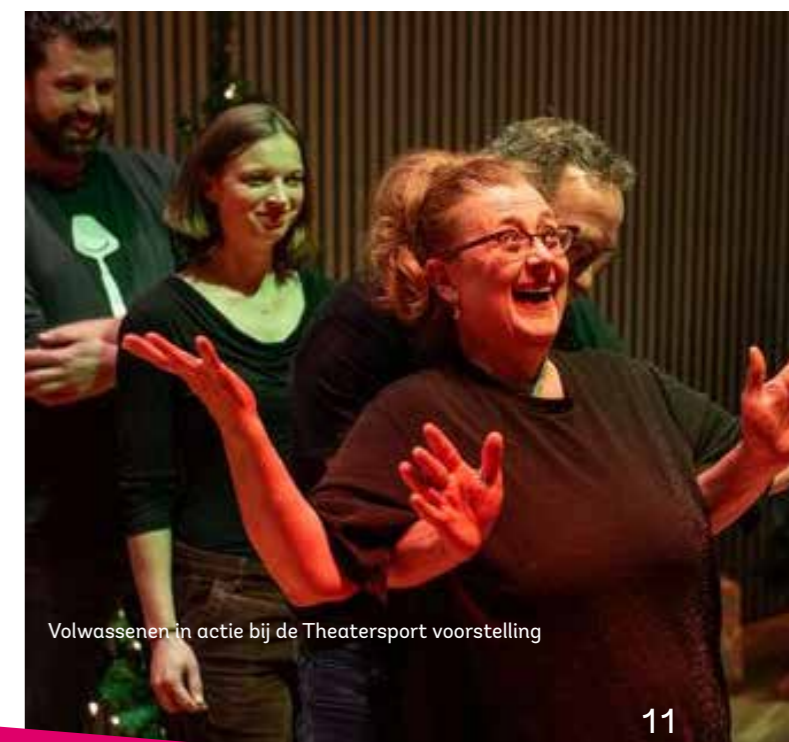
Volwassenen in actie bij de Theatersport voorstelling

Mensen volgen bij ons lessen voor nieuwe vaardigheden, ontmoeting, ontspanning en persoonlijke groei. Het afgelopen jaar heeft bewezen dat onze strategische keuzes en investeringen succesvol zijn en we zullen deze koers voortzetten.